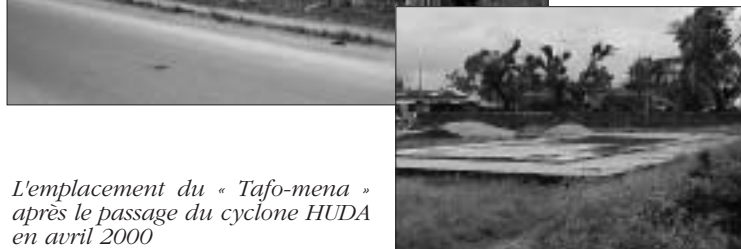
L'emplacement du « Tafo-mena » après le passage du cyclone HUDA en avril 2000