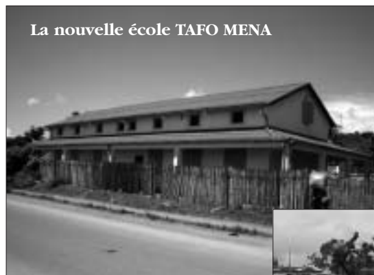
La nouvelle école TAFO MENA