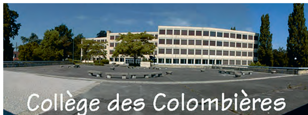
Collège des Colombières

Les Colombières ont 40 ans ! Vendredi 24 avril Animations, expos, stands, disco «années 80» seront au programme Informations sur www.colombieres.ch ou sur la page Facebook «Les Colombières ont 40 ans !»