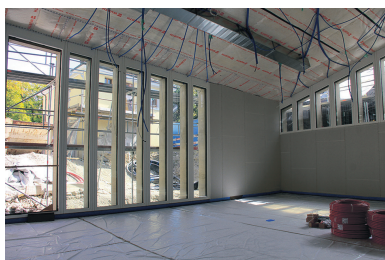
L'intérieur du futur restaurant scolaire.

Les travaux de Bon Séjour vont bon train. Une première étape s'est achevée à Pâques 2019 avec la remise du bâtiment de l'Ancienne Préfecture, dans lequel plusieurs associations ont pu reprendre leurs activités. Parallèlement, le gros œuvre des autres bâtiments a avancé: l'enveloppe des restaurants scolaires, de la tourelle et de l'entrée des caves de Bon Séjour ont été terminés au cours de l'été.